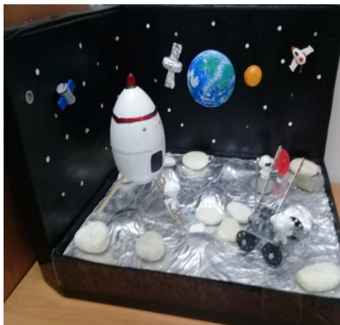
Волшебный мир космоса